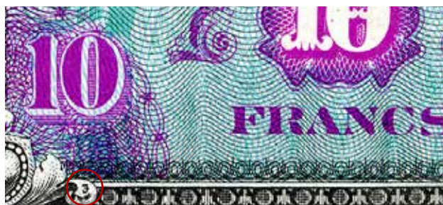
Localisation du symbole « F » dans le coin inférieur gauche