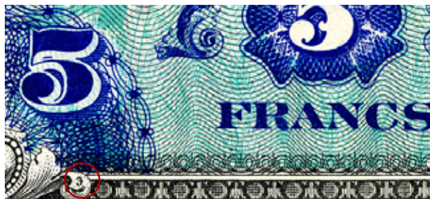
Localisation du symbole « F » dans le coin inférieur gauche